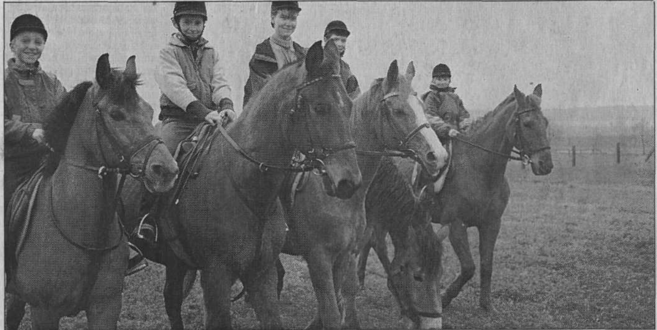
Hoch zu Roß sieht die Welt ganz anders aus. Nach der Schule geht es zum Reitstall.