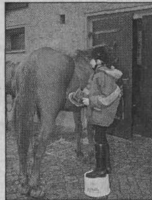
Wenn das Pferd größer ist...